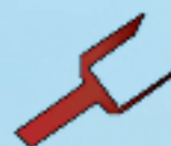
Fourche largeur 8 cm