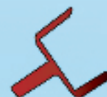
Fourche largeur 15 cm